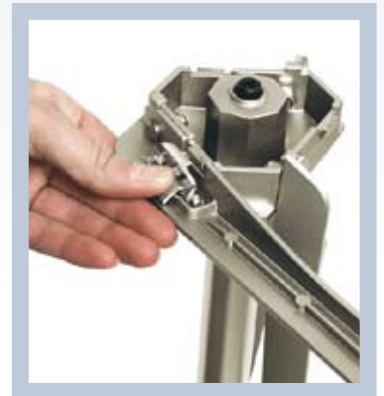
Stödbenen faller smidigt ut och ihop med en knapptryckning.