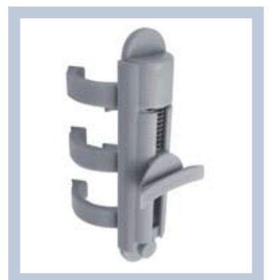
Det nedre fjäderbaserade fästet gör att bilden hålls sträckt. Alltid perfekt resultat!