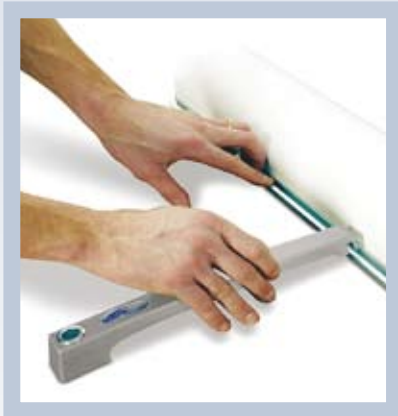
Genomtänkt design i minsta detalj. Haka fast stödfoten nedtill.