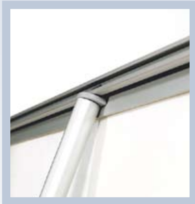
Fäst stödpinnen upptill och det är klart.